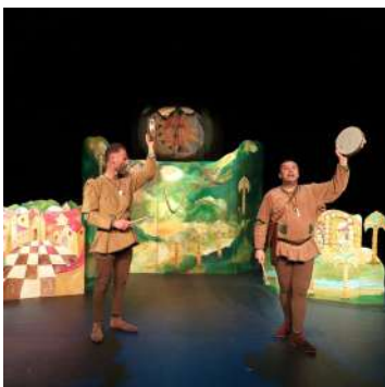
La gràcia del Joglar.