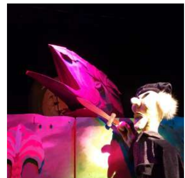
La raó abans que la força.