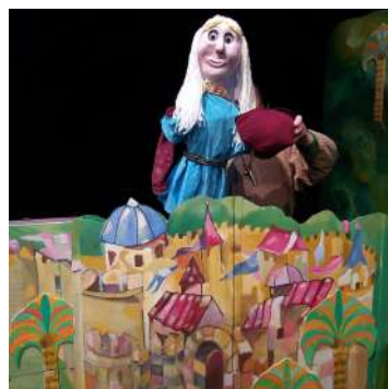
La valentia siga quin siga el gènere.